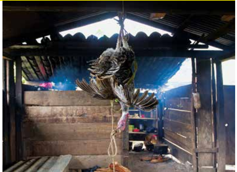
En los caracoles zapatistas las mujeres tienen gran relevancia, tanto en la toma de decisiones como en los trabajos colectivos. Ellas manejan granjas de pollos, apicultura y tiendas colectivas.